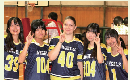
県立下妻第一高等学校

日本での生活、そして下妻第一高校での学校生活を通して、私は本当に多くのことを学びました。この経験は、他では得られない大切な学びを私に与えてくれました。授業での知識だけでなく、周りの人たちから人生についての大事なことも学びました。来日したとき、私は日本に知り合いが一人もおらず、新しい学校生活に大きな不安を感じていました。でも、学校へ行くとすぐにその不安はなくなりました。クラスメートや他の学年の生徒までが話しかけてくれ、先生方もいつも親切に助けてくださいました。皆さんの温かさとおもてなしの心に何度も支えられました。文化や言葉が違う私を、誰も「よそ者」として扱うことはありませんでした。日本語がまだ上手ではなくても、友達はいつも辛抱強く聞いてくれ、わからないことは丁寧に説明してくれました。この経験から、言葉が通じなくても相手に対して思いやりと忍耐を持つことの大切さを学びました。日本での生活を通して、私は人として大きく成長できたと感じています。フィンランドに帰ったとき、周りの人がその成長に気づいてくれたら嬉しいです。そしてその成長は、下妻第一高校の皆さんのおかげです。