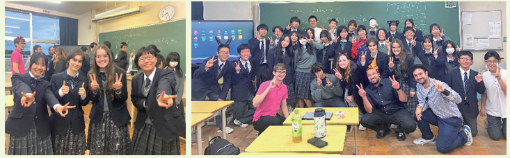
県立勝田中等教育学校

WWLでは、Global Exchange Educationと連携し、世界中から留学生を受け入れています。今年度は拠点校に6名、連携校（県立下妻第一高等学校）に1名の留学生を受け入れました。留学生達は聴講生として実際にクラスに入り、日本人の生徒達と同じように学校生活を送ります。